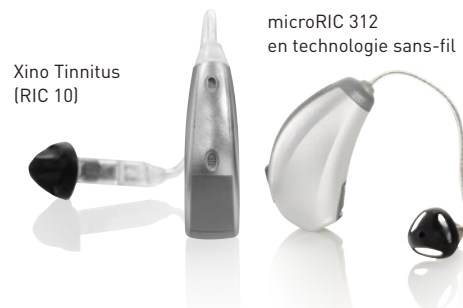
Xino Tinnitus (RIC 10)

Acouphènes et perte auditive allant souvent de pair, Tinnitus intègre également une solution auditive à la pointe de la technologie, d'autant plus qu'il est scientifiquement prouvé que l'amplification soulage les personnes concernées.